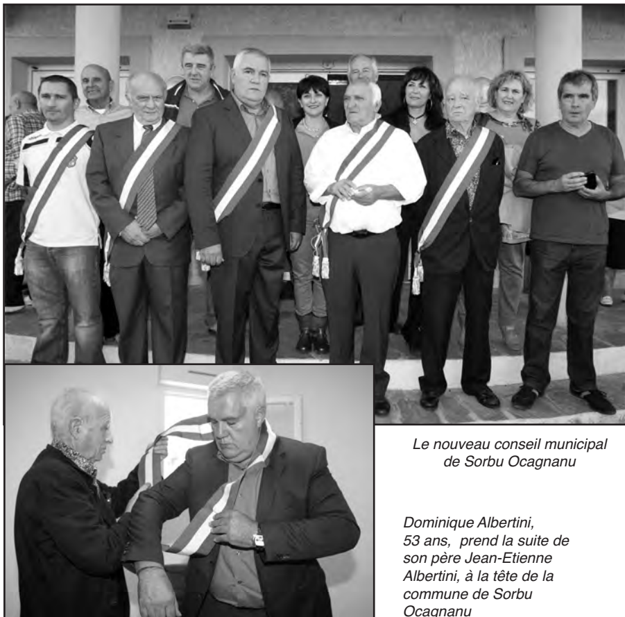
Le nouveau conseil municipal de Sorbu Ocaganu